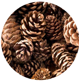
Pommes de pin (petites)