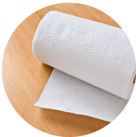
Des feuilles d'essuie-tout