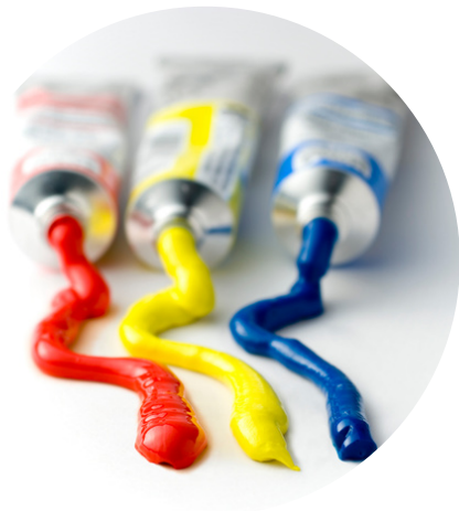
Des tubes de peinture