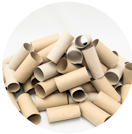
Des rouleaux de papier toilette